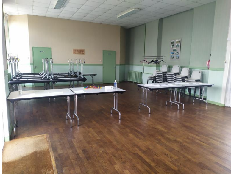
Figure 1 : Présentation du premier espace, à l'entrée de la permanence publique

Puis les participants peuvent se rendre dans un deuxième espace comprenant :