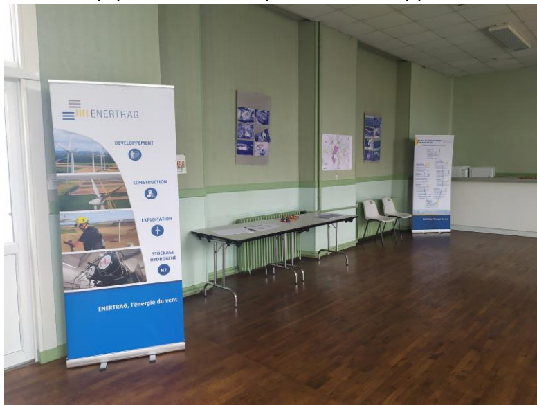
Figure 2 : Présentation du deuxième espace d'échange