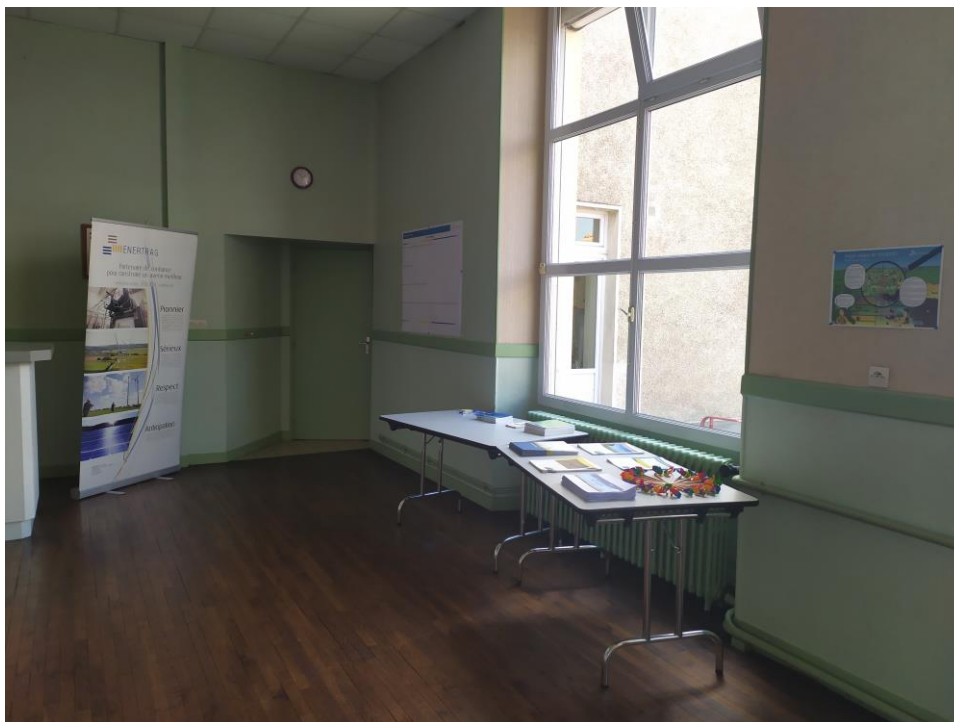
Figure 3 : Présentation du troisième espace d'échange